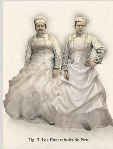
Fig. 3: Les Hazershoks de Pest

Dans l'île, la nuit tombée, les Hazershoks préparent le sacrifice rituel de Duna, leur égérie. Andreï, tombé sous le charme, libère Duna de sa cage dorée, mais leur relation est impossible, Le Danube s'empare d'Andreï et le noie. Flottant sur le Fleuve, Père Courage vient recueillir Duna sur son dos, et l'emmène au gré du courant, suivi par sa bande d'Hazershoks.